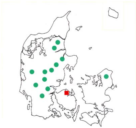
Hovedlokaliteterne (= 12) for de ialt 20 danske udgangsbevoksninger (●), samt frøplantagens placering (■)

Plustræ nr. K122 valgt i afd. 124, Fussingø i 1952